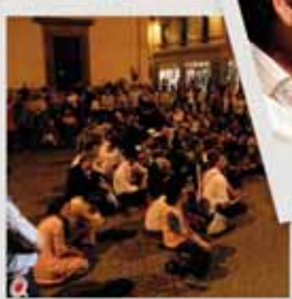
INVASIONE A PONTEDERA