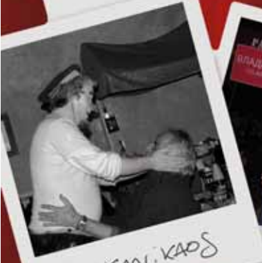
BAL KONI KADIS