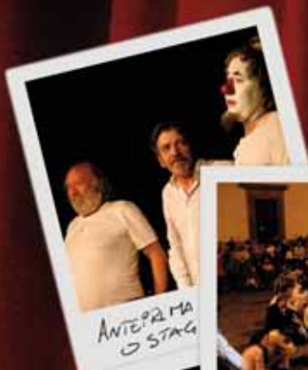
ANTEPRIMA O STAG