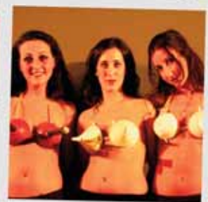
Elena Eleanora Abbia de