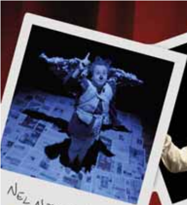
NEL NOME MIO