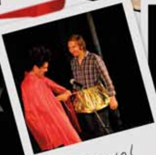
QUI RIDO IO!